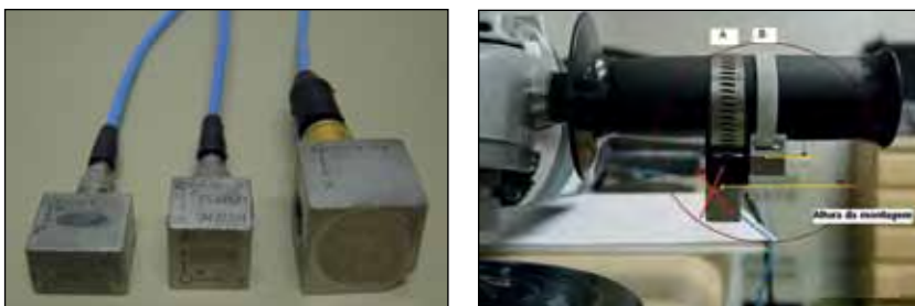
Figura 4 (a) Exemplo de montagens de acelerômetros triaxiais; (b) Exemplo de tipos de acelerômetros triaxiais

Sempre que possível, o acelerômetro deve ser fixado diretamente à superfície vibrante por meio de prisioneiro. Outra alternativa é a fixação do acelerômetro em um cubo metálico, que deve ser pequeno e leve tanto quanto possível. Este conjunto deve ser acoplado à superfície vibrante por meio de abraçadeiras metálicas ou plásticas. A Figura 4(a) tem apenas o objetivo de exemplificar duas formas de montagens. A montagem “A” não é recomendada devido à maior distância entre o acelerômetro e a superfície vibrante. A montagem “B”, além de aproximar o acelerômetro da superfície vibrante, resulta em menor massa por utilizar acelerômetro de menor tamanho e abraçadeira mais leve. A Figura 4(b) ilustra alguns tipos de acelerômetros triaxiais.