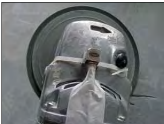
Figura 5 Ilustração de montagem em situações nas quais o operador não utiliza o punho auxiliar da ferramenta

A Figura 5, mostrada a seguir, apresenta uma situação de montagem e posicionamento do acelerômetro em uma condição de trabalho na qual o operador não faz uso do punho auxiliar da ferramenta, uma vez que segura diretamente no corpo dela. A mesma figura também ilustra uma forma de fixação do acelerômetro e de proteção da conexão e do cabo elétrico.