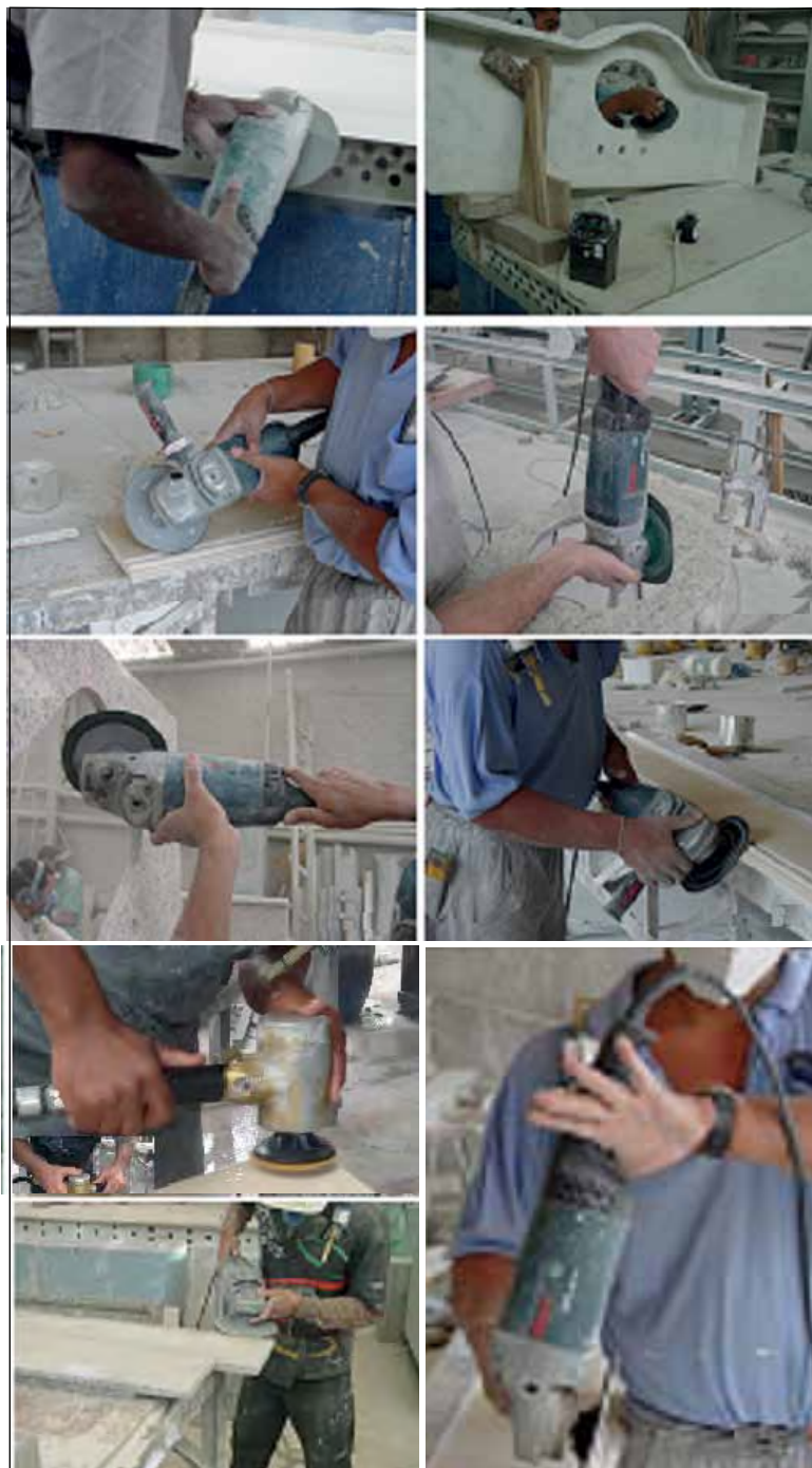
Figura 3 Ilustração de diferentes posturas e empunhaduras dos operadores durante rotinas de trabalho operando ferramentas manuais